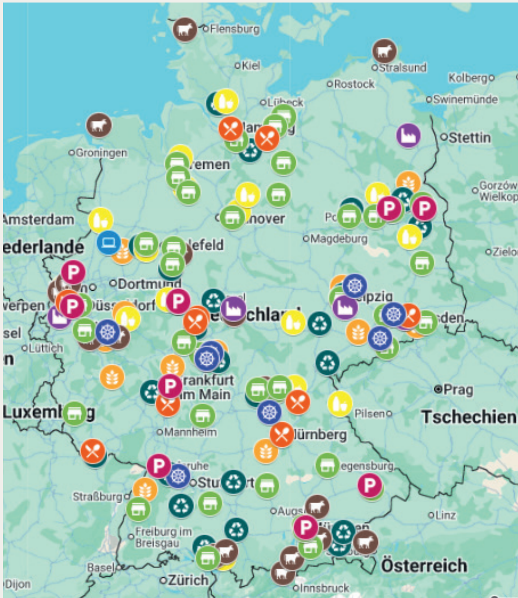
Abbildung 2: Online-Karte aller Rückmeldungen