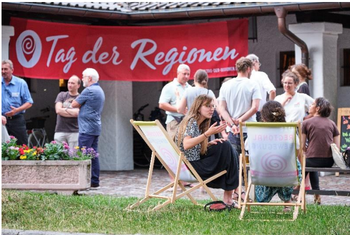
Tag der Regionen Netzwerk auf dem 11. Bundestreffen der Regionalbewegung in Farchant

Pressebilder zur freien Verwendung unter folgendem Nachweis: