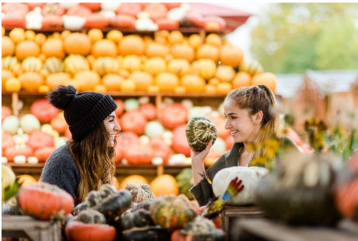
Tag der Regionen Veranstaltung auf dem Getrudenhof in Hürth