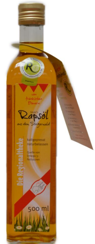
Bundestreffen der Regionalbewegung